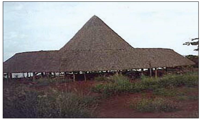
Edificação de madeira com cobertura de fibras vegetais

5.2.1 As fontes de calor que podem inflamar as fibras combustíveis devem ser isoladas e mantidas à distância, mínima, de 5 m.