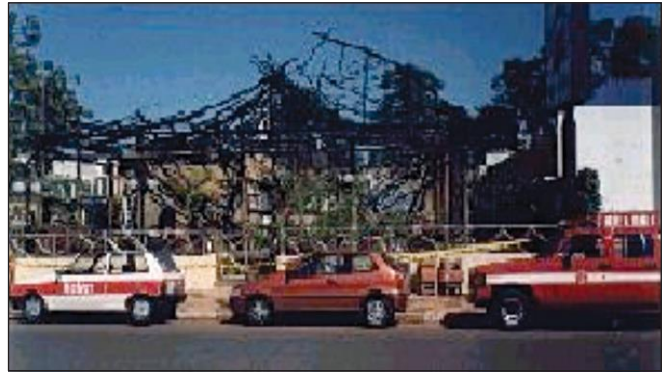
Incêndio em edificação com cobertura de fibras vegetais (ocupação de bar e restaurante)

5.5.4 Recomenda-se a utilização de sistemas de aspersão de água que visam a manter as fibras permanentemente úmidas ou destinadas ao próprio combate das chamas, sem prejuízo das demais medidas constantes desta IT.